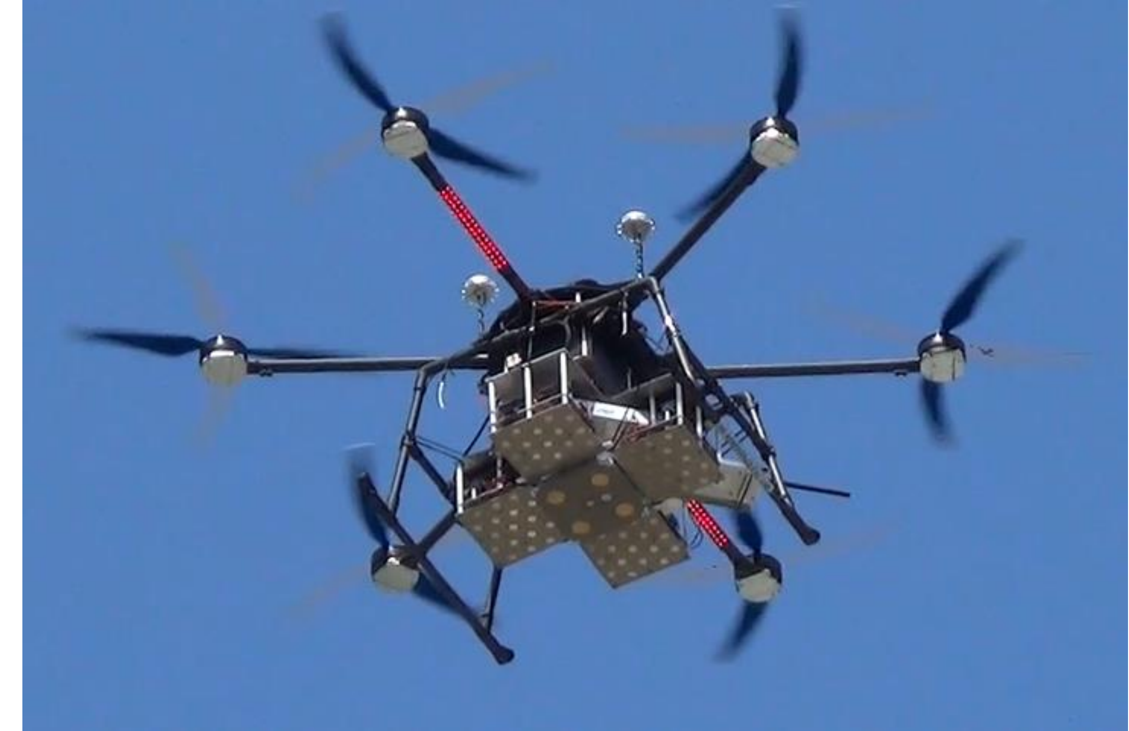
受電電力によりLED点灯

受電部を搭載したマルチコプタへのマイクロ波による無線送電を実施し、電力として取り出せることを確認した。